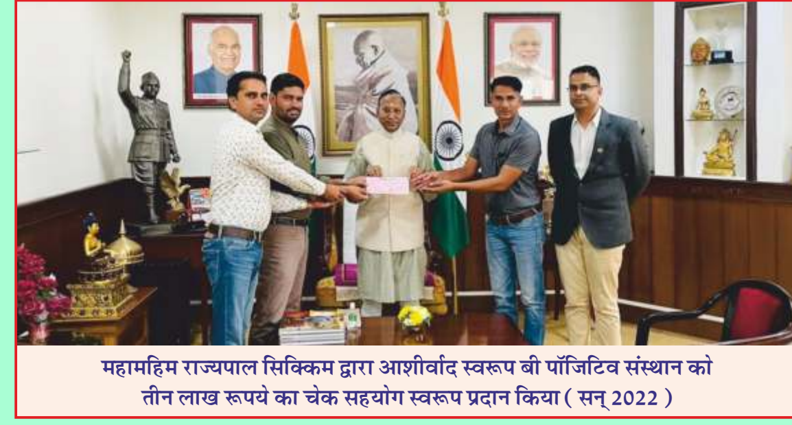
महामहिम राज्यपाल सिक्किम द्वारा आशीर्वाद स्वरूप बी पोजिटिव संस्थान को तीन लाख रुपये का चेक सहयोग स्वरूप प्रदान किया ( सन् 2022 )