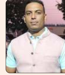
भूपेन्द्र यादव रेल्वे भारत सरकार