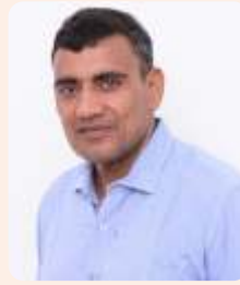
रामगोपाल गीला गदड़ी रेनवाल