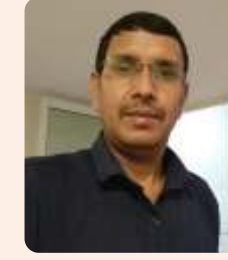
श्रवण मैला जयपुर