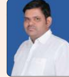
प्रभू जाँगिड़ गायत्री बिल्डर्स