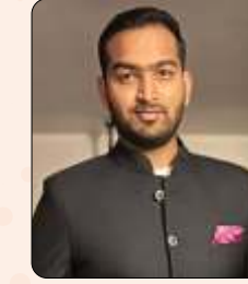
अक्षय सिंधी मसाला मिनिस्ट्री