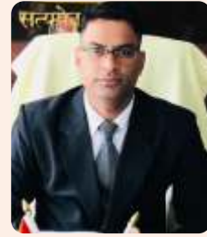
राज यादव आई.ए.एस