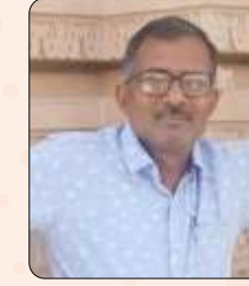
हनुमान यादव भारती स्कूल