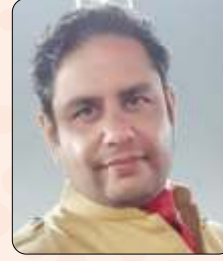
वीर प्रताप सिंह बधाल रिसोर्ट